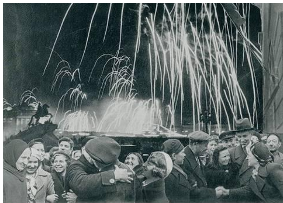
-Великая победа одержана советскими войсками под Ленинградом:

Победе радовалась вся страна, но эта радость была со слезами на глазах, так как в каждой семье, в каждом доме кто-то погиб на этой страшной войне.